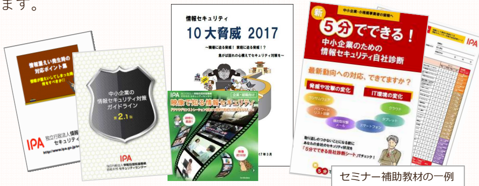
セミナー補助教材の一例

中小企業が情報セキュリティ対策を実施・支援する際に必要な、実践的な知識を学んでいただくために、全国各地で無料セミナーを開催します。