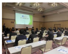
← YIC情報ビジネス専門学校での様子