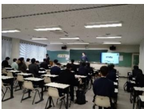
← 山口コアカレッジでの様子

来年度は、企業と学生が交流できる場を設け、より充実した内容にしたいと思っております。